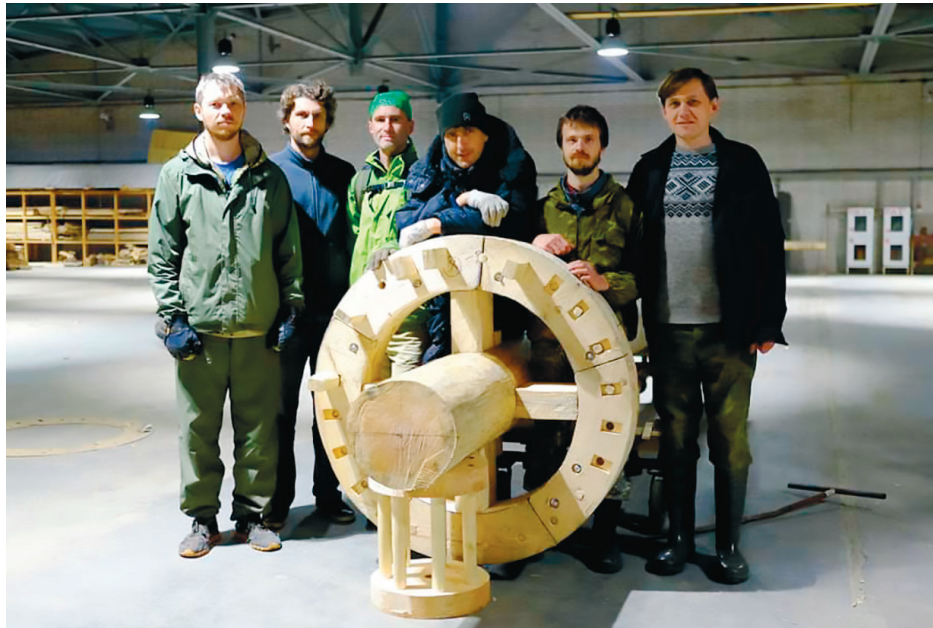
Haukkasaaren tuulimyllyä varten rakennettiin Kizhin saarella puisia rattaita

saassa peruutettiin pandemian vuoksi kesältä ja tilalle käynnistettiin verkko-ohjelma, joka on tuottanut Youtube-kanavalle luentoja Karjalan etnografiasta, puurakennuksista, puisten muistomerkkien suojelusta, perinteisistä puurakentamisen tekniikoista jne. Huhti-kesäkuussa projekti haki ja sai